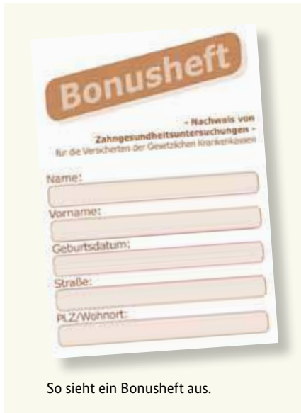
So sieht ein Bonusheft aus.

Gesunde Zähne sind ein Stück Lebensqualität. Deshalb sind regelmäßige Vorsorgeuntersuchungen wichtig – auch wenn Sie keine Beschwerden haben. Die gesetzlichen Krankenkassen übernehmen auch die Kosten dieser Vorsorgeuntersuchungen. Diese Untersuchungen helfen, bestimmte Erkrankungen frühzeitig zu erkennen und zu behandeln. Sie können dafür von Ihrer Krankenkasse ein sogenanntes „Bonusheft“ erhalten. In diesem Heft werden die Vorsorgeuntersuchungen eingetragen. Wenn Sie nachweisen können, dass Sie mindestens einmal im Jahr (unter 18 Jahren mindestens einmal pro Halbjahr) bei einer Zahnärztin oder einem Zahnarzt waren, zahlt die Krankenkasse einen höheren Zuschuss, sofern ein Zahnersatz notwendig wird.