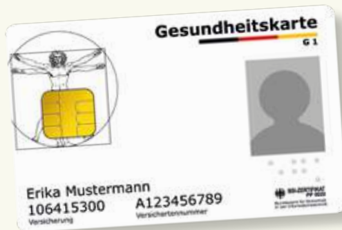
Musterbeispiel einer Gesundheitskarte

Bitte nehmen Sie immer Ihre elektronische Gesundheitskarte mit, wenn Sie Gesundheitsdienste in Anspruch nehmen. Seit dem 1. Januar 2015 gilt ausschließlich diese Karte als Berechtigungsnachweis, um Leistungen der gesetzlichen Krankenversicherung in Anspruch nehmen zu können. Auf der elektronischen Gesundheitskarte sind Ihr Name, Ihr Geburtsdatum und Ihre Anschrift sowie Ihre Krankenversicherungsnummer und Ihr Versichertenstatus (Mitglied, Familienversicherter oder Rentner) als Pflichtdaten gespeichert. Die elektronische Gesundheitskarte enthält außerdem ein Lichtbild von Ihnen.